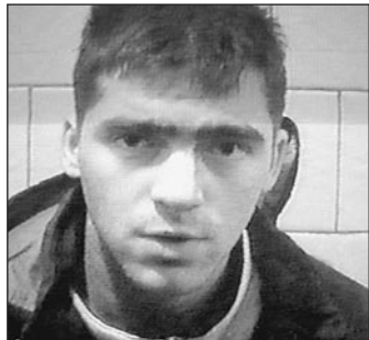
Таир Джазифов. Убийца Маши