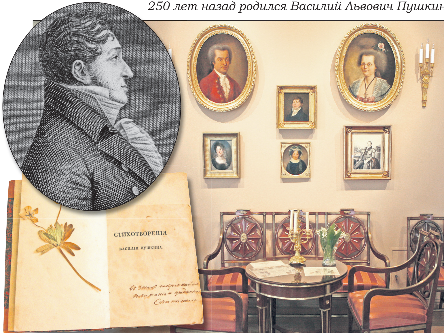
Государственный музей А.С. Пушкина

250 лет назад родился Василий Львович Пушкин