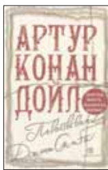
Конан Дойл А. Повествование Джона Смита / Пер. с англ. Д.Ускова. М.: СЛОВО/SLOVO, 2012. — 240 с.

5 Сенсационная находка Британской Национальной Библиотеки — неопубликованный роман сэра Артура Конан Дойла: отправленная издателю рукопись потерялась, и автору пришлось восстанавливать ее по памяти. В главном герое угадываются черты самого Конан Дойла, да и жизненные обстоятельства схожи.