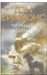
Симмонс Д. Черные холмы / Пер. с англ. Г.Крылова. М.: Эксмо; СПб.: Домино, 2012. — 544 с. — (Бестселлер).

6 Это случилось в великую и грозную эпоху Индейских войн. В мальчика влился дух убитого предводителя бледнолицых — и он обрел способность «видеть то, что было, и то, что будет». С этим даром, благодатным и опасным одновременно, ему предстоит вписать свое имя в мистическую Книгу имен.