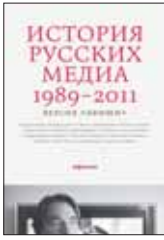
История русских медиа 1989–2011. Версия «Афиши». М.: Компания «Афиша», 2011. — 304 с.

2 Это не учебник для журналистов и не энциклопедия СМИ, но книга весьма познавательная — история самых ярких медиафеноменов постсоветской России — от «Коммерсанта», «Матadora» и «Птюча» до «Esquire», «Сноба» и «Дождя». Рассказывают о медийных революциях их непосредственные организаторы.