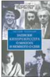
Татарский Е. Записки режиссера о многих и немногих о себе. СПб.: БХВ-Петербург, 2012. — 224 с. — (Лаборатория творчества).

7 Воспоминания известного кинорежиссера, автора фильмов «Приключения принца Флоризеля», «Джек Восьмеркин — “американец”» — о тех, кого он знал, с кем работал, кого любил и кого «не очень». Среди героев книги — Владимир Венгеров, Исаак Шварц, Кирилл Лавров, Олег Даль, Марина Влади и многие другие.