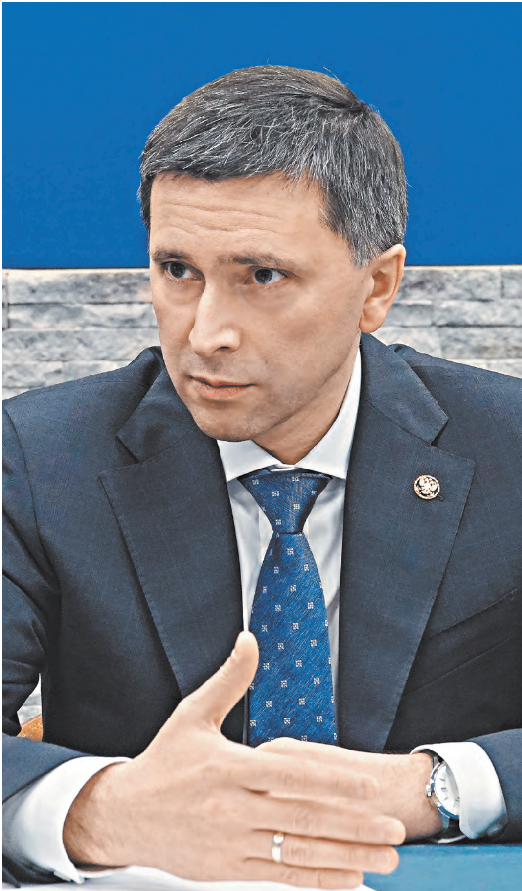
Дмитрий Кобылкин: Всем понятно, что дальше, ничего не делая, жить нельзя. «Мусорную» реформу откладывать было невозможно.