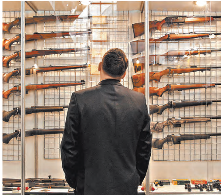
На российском рынке гражданского оружия выбор богатый. Но правила регистрации и хранения этих изделий достаточно строгие.

Речь идет не об очередных законодательных ужесточениях, что вызывает вполне ожидаемое раздражение пяти миллионов владельцев гражданского оружия, а о строгих правилах для самих сотрудников лицензионно-разрешительных подразделений. В них прописано: в какие сроки принимать и выдавать разрешения, что необходимо требовать от обладателей стволов и что требовать категорически запрещено, какие медсправки надо получить, сколько за это платить, какие нужны документы.