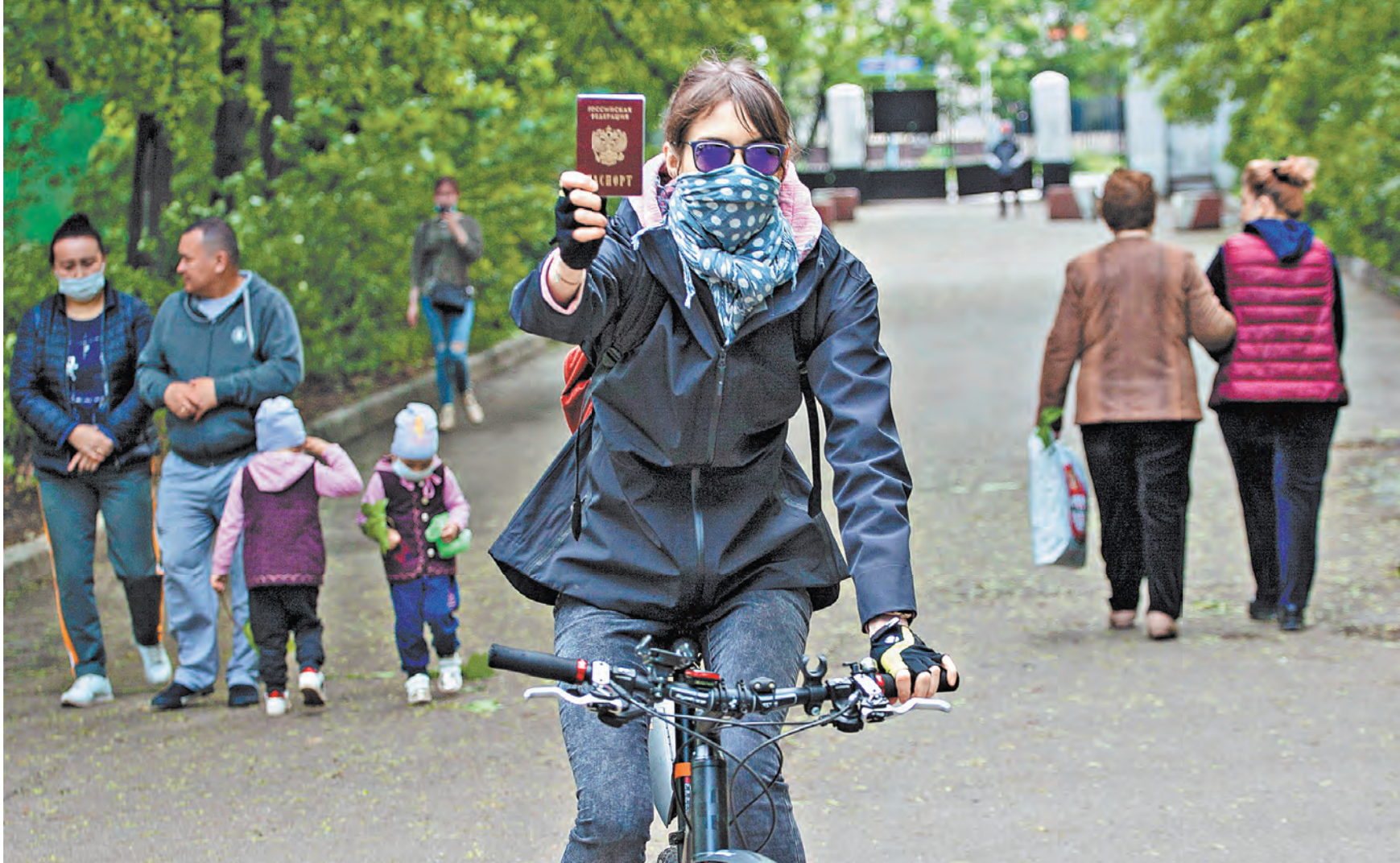
В упрощенном порядке российский паспорт оформляется в течение трех месяцев. Число граждан, имеющих право на такую процедуру, в последнее время увеличивается.

Если же у трудоспособного отца нет такой особо ценной профессии, он не является беженцем, у него нет выдающихся достижений в области науки или культуры, то, получается, ему бы пришлось долгие годы жить рядом со взрослым сыном на правах чужеземного гостя. Это неправильно.