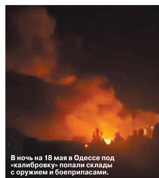
В ночь на 18 мая в Одессе под «калибровку» попали склады с оружием и боеприпасами.