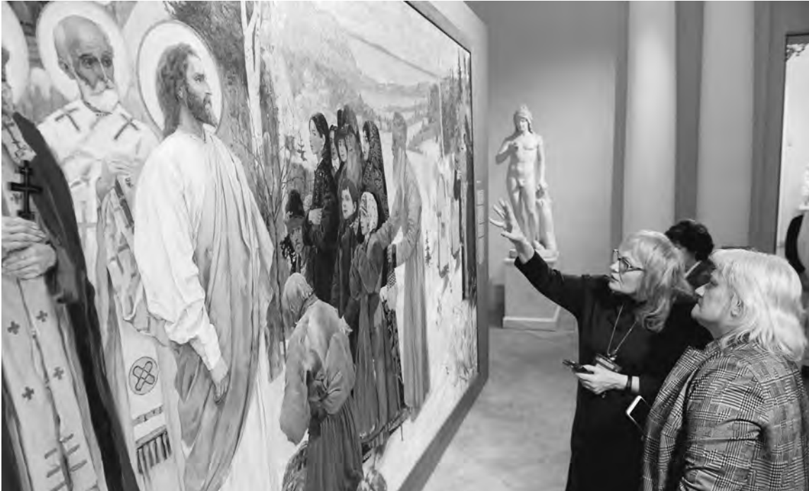
Картина Михаила Нестерова «Святая Русь» предстала перед зрителями после сложной полугодовой реставрации. Специалисты Русского музея укрепили красочные слои и грунт и полностью остановили процесс разрушения шедевра. Полотно можно увидеть в Садовом вестибюле Михайловского дворца. Выставка одной картины продлится до 25 ноября.