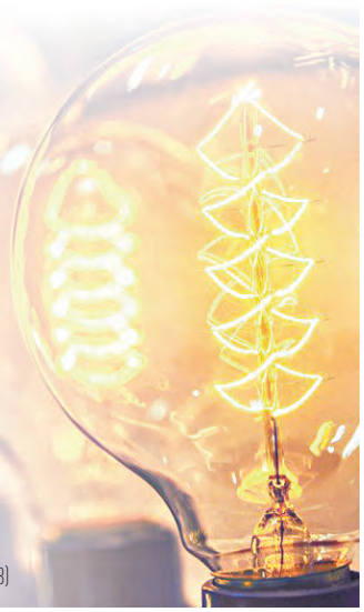
ИНФОГРАФИКА: ИГ. / МАКСИМ ИВАНОВ / ЕКАТЕРИНА ДЕМЕТЬЕВА

В Новосибирске рекультивируют мусорный полигон