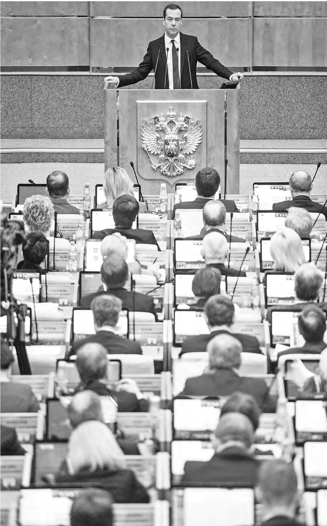
Нынешний отчет перед депутатами Госдумы был пятым по счету для Дмитрия Медведева.

Главным политическим событием ушедшего года Медведев назвал выборы в Госдуму. Ведь единый день голосования определил стратегический курс России на ближайший политический цикл. «Выборы в Думу показали, что важнее всего в работе власти для граждан — последовательность и ответственность за принимаемые решения, способность слышать их проблемы и выполнять обещания», — оценил глава правительства. Он уверен, что в ходе предстоящих президентских выборов люди опять же проголосуют за стабильность и развитие. «Борьба как в любой президентской гонке будет серьезной. Но мы с вами никогда не превращали политическую борьбу в войну и делать этого не будем», — заявил Медведев.