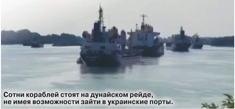
Сотни кораблей стоят на дунайском рейде, не имея возможности зайти в украинские порты.