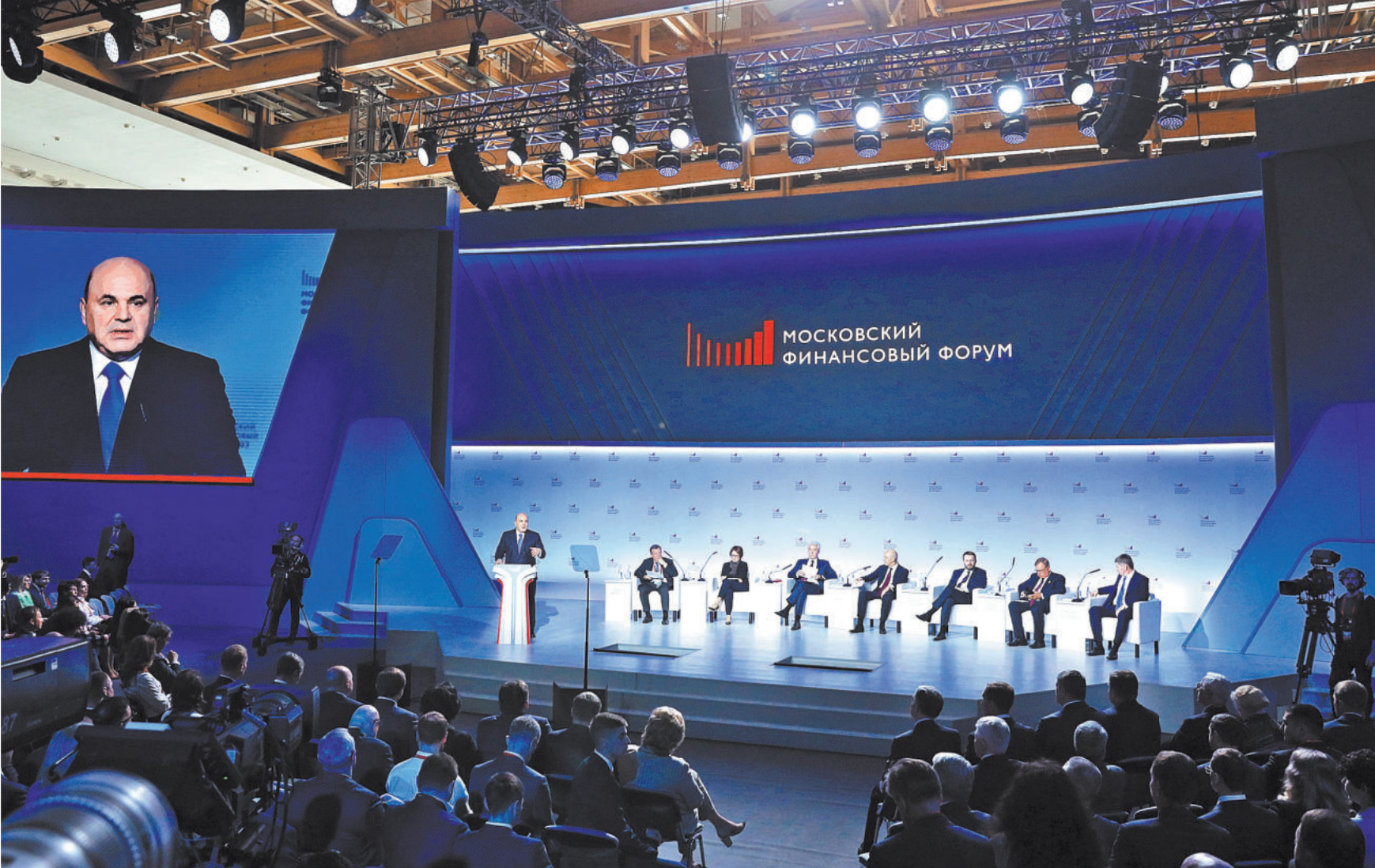
Михаил Мишустин заявил о планах ускорить переход к более широкому использованию рубля.

Немалую роль в этих позитивных процессах сыграл ответственный подход к финансовой политике, прежде всего сохранение сбалансированного федерального бюджета. На прошлой неделе правительство утвердило проект главного финансового документа страны на следующие три года. «Доходная составляющая была значительно увеличена, что позволит профинансировать больше расходов, гарантировать четкое выполнение в первую очередь всех социальных обязательств и обеспечить дальнейшее развитие экономики предложения, как нам поручил президент, с акцентом на собственный потенциал страны и ее ресурсы», — рассказал Михаил Мишустин. Базовый прогноз социально-экономического развития предполагает сохранение ежегодных темпов роста на уровне выше 2% в течение всех следующих трех лет.