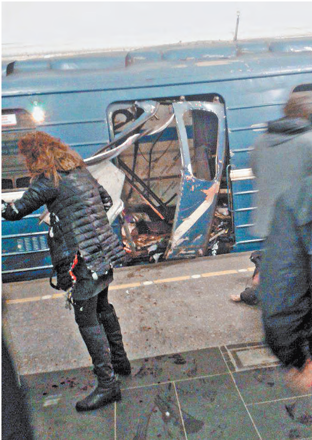
Взрыв прогремел в 14.40 на перегоне между станциями «Сенная площадь» и «Технологический институт».

Эксперты также сделали выводы о том, что собой представляла взорвавшаяся бомба.