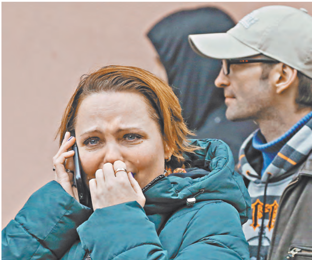
Очевидцы страшной трагедии не могли сдержать слез.

5 За кражу электричества предлагают сажать на 6 лет