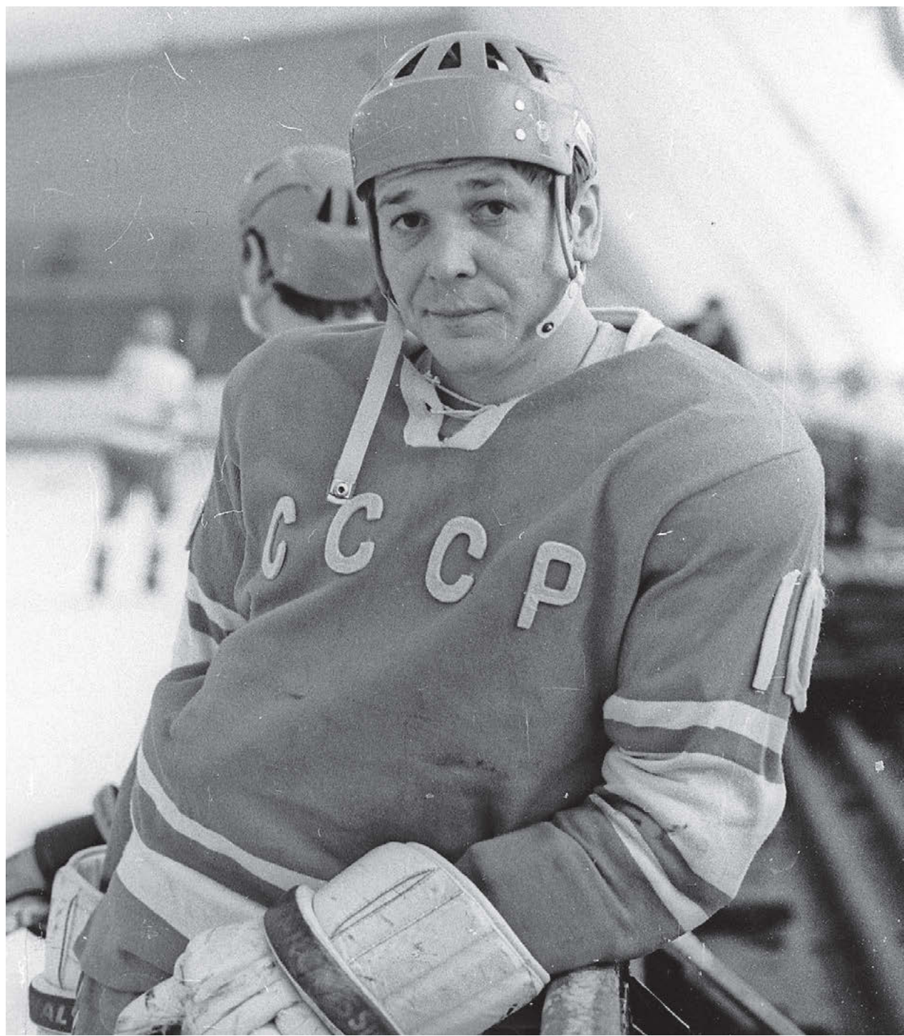
Легенда московского «Динамо» и сборной СССР Александр Мальцев