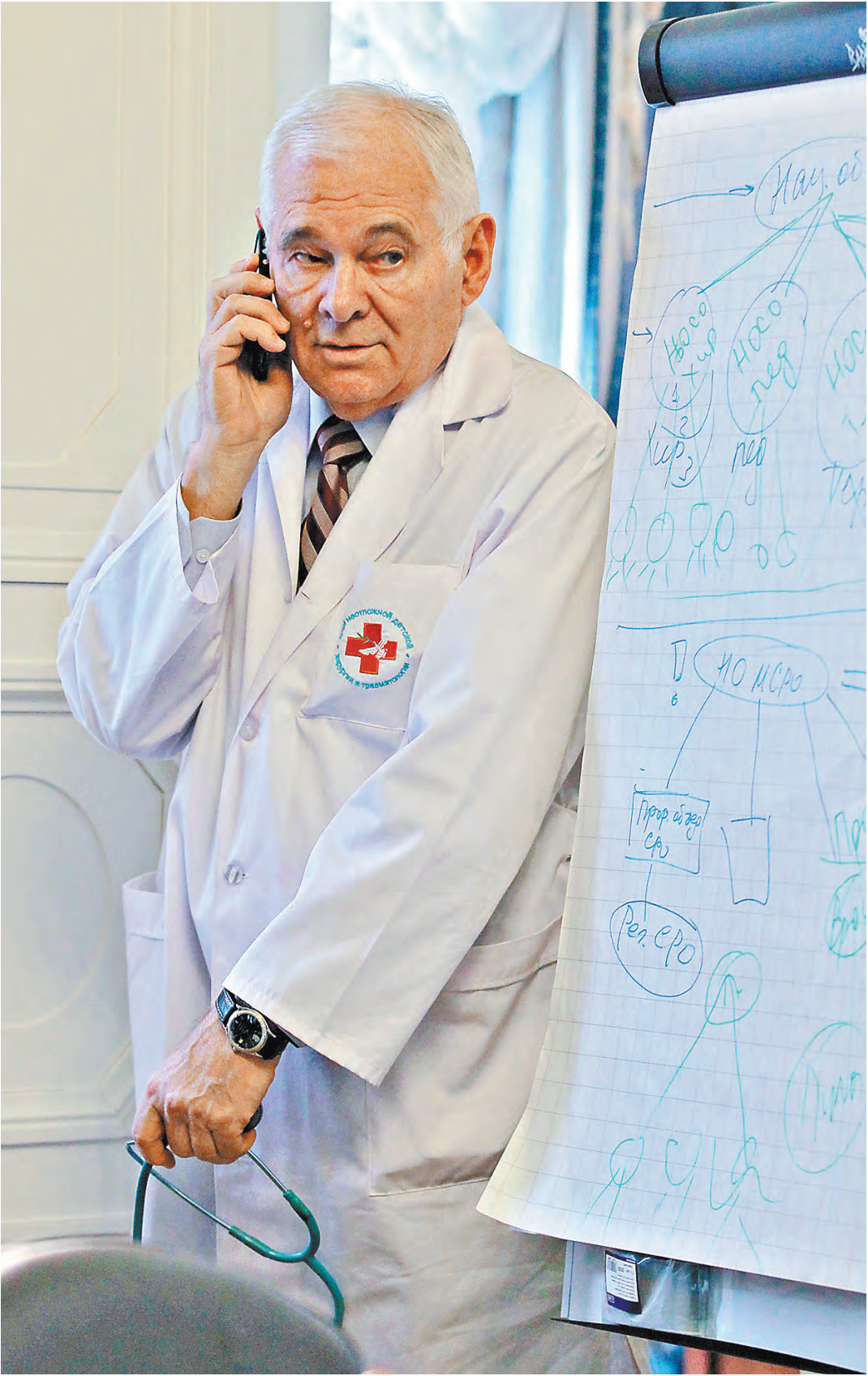
Леонид Рошаль: Нужна четкая и профинансированная государственная программа по решению кадровой проблемы в здравоохранении.

Мы понимаем, что это скрытая форма распределения. Национальная медицинская палата (НМП) активно поддержала идею министра о проведении аккредитации врачей и конкретно помощи в ее реализации, а также активно участвовала в разработке профессиональных стандартов «педиатр участковый» и «терапевт участковый», что является основой для аккредитации. Руководителями всех региональных аккредитационных комиссий были представители НМП.