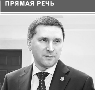
Дмитрий Кобылкин, министр природных ресурсов и экологии РФ:

миллиарда рублей. Инвесторы пока размышляют над предложением, просчитывая выгоду от таких вложений. ●