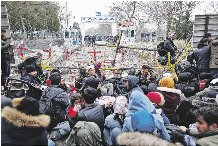
Силы греческих пограничников и новой волны беженцев из Сирии явно неравны (на фото — погранпереход Эдирне, Турция)

Как ЕС намерен справляться с новым миграционным кризисом