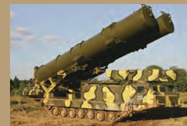
СИСТЕМА ПВО И ЕЕ ВОЗМОЖНОСТИ В ЛОКАЛЬНОЙ ВОЙНЕ