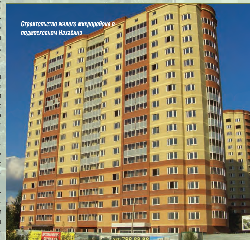
Строительство жилого микрорайона в подмосковном Нахабино