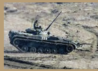
БОЙ В УСЛОВИЯХ ОГРАНИЧЕННОЙ ВИДИМОСТИ