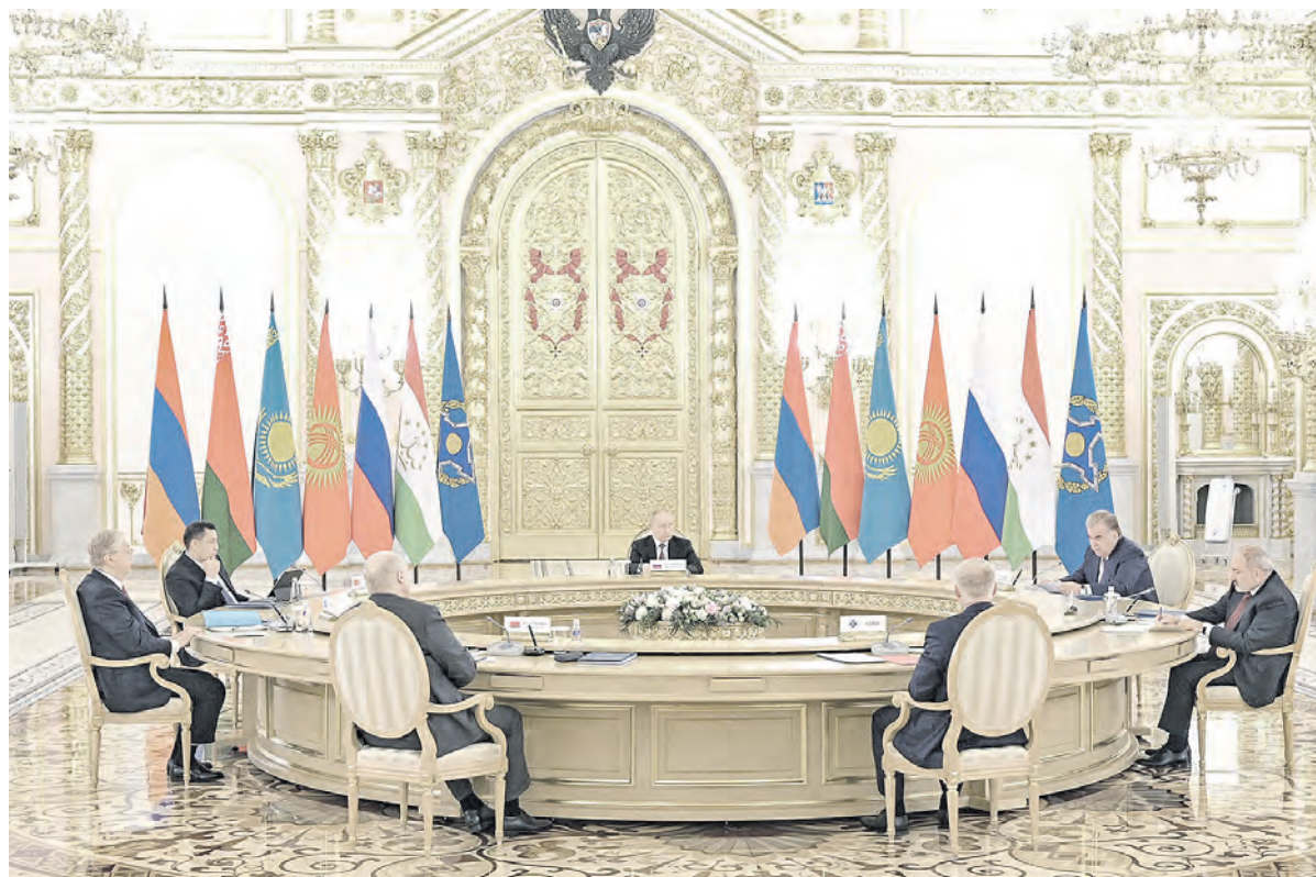
Главы стран-участниц ОДКБ подчеркнули на саммите единство своих взглядов и оценок в связи с происходящими в зоне интересов организации событиями

Главы государств – членов ОДКБ обсудили основные вызовы и наметили пути развития организации