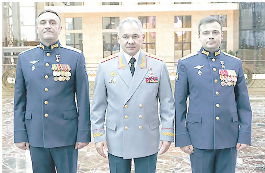
Министр обороны Российской Федерации Герой России генерал армии Сергей Шойгу с героями-лётчиками после вручения им Золотых Звёзд