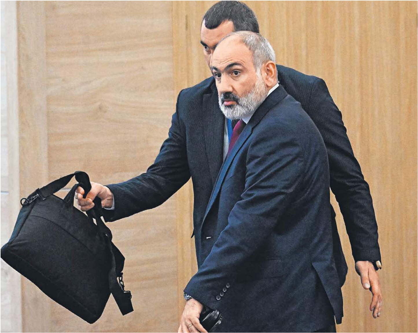
Премьер-министр Армении Никол Пашинян утверждает, что мирный договор с Азербайджаном готов уже на 70%

Проблема в том, что переговоры Еревана и Баку о мире, поражавшие своей интенсивностью в первой половине года, сейчас, можно сказать, встали. Последние контакты сторон — на уровне глав МИДов — состоялись в июле. Министры иностранных дел Азербайджана и Армении Джейхун Байрамов и Арарат Мирзоян виделись сначала в Брюсселе, а потом в Москве.