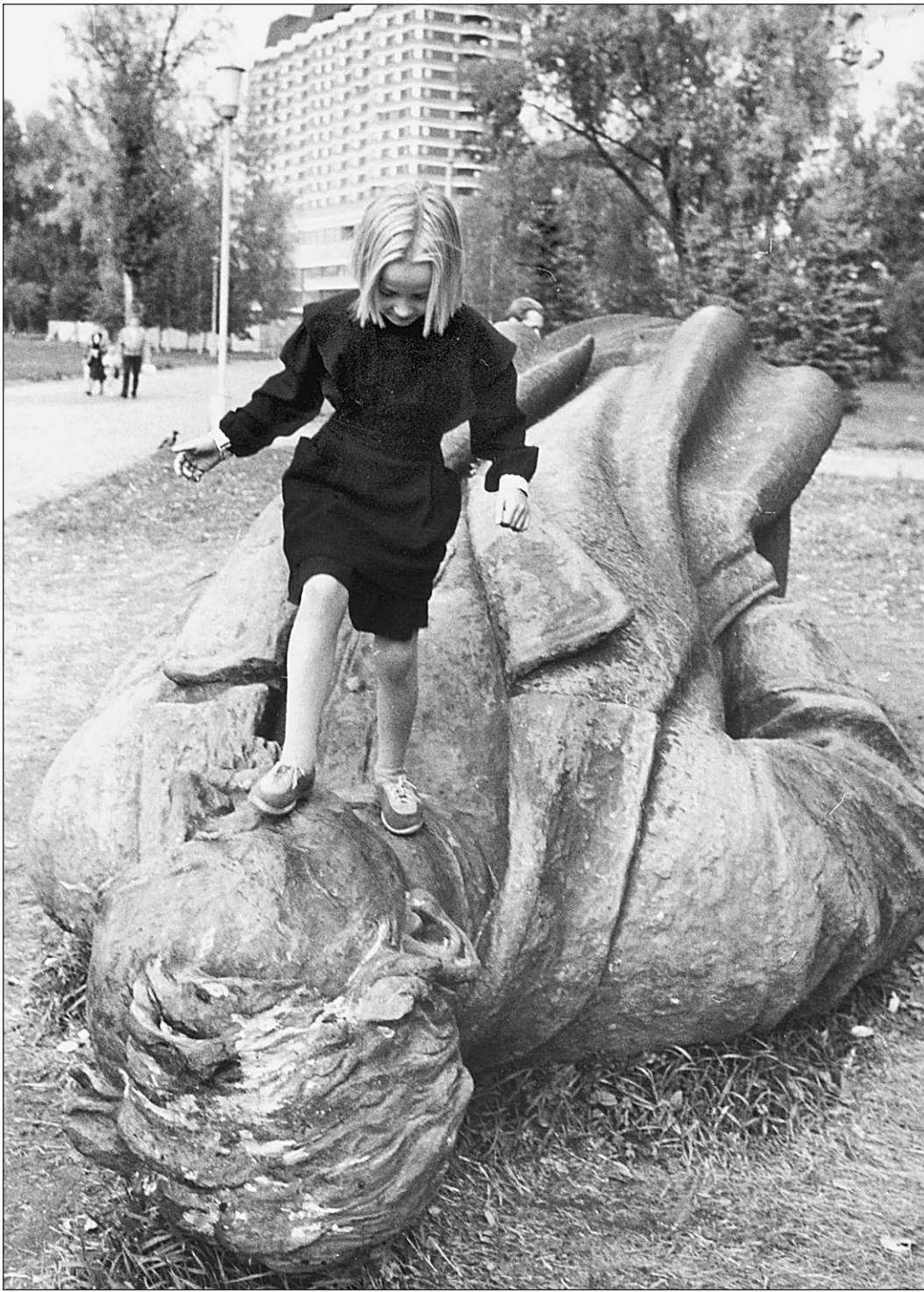
Рано или поздно у всякого фанатизма пропадает аура

В этом был весь фанатизм польского дворянина Дзержинского, подмеченный попавшим к