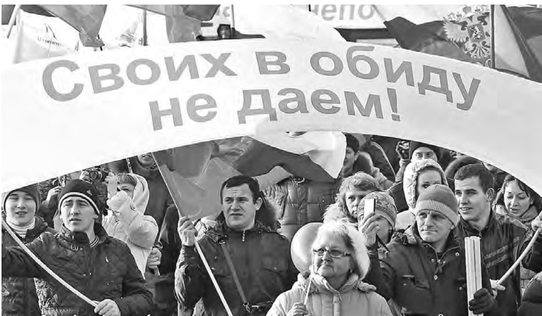
В многотысячной колонне, расцветившей центр Москвы тысячами флагов, люди шли целыми семьями.