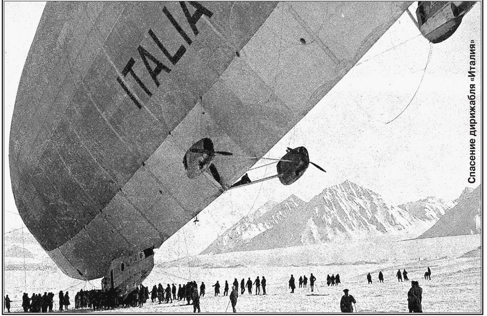
Спасение дирижабля «Италия»