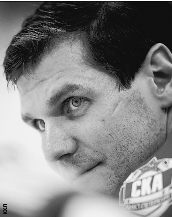
Игорь ЛАРИН Окончание - стр. 6

- Евгений в курсе, что это вы сосватали его в «Айлендерс»?