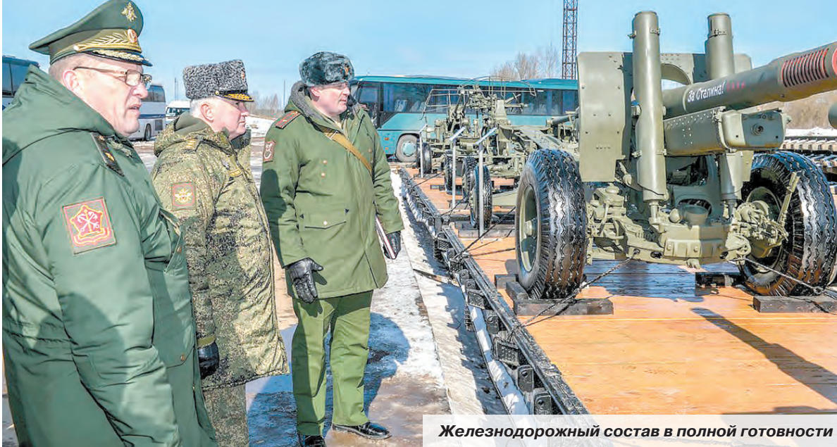
Железнодорожный состав в полной готовности

Совсем скоро с Ярославского вокзала Москвы отправится «Эшелон Победы». Маршрут передвижной выставки проложен через крупные города на территории ЗВО. Готовность состава к путешествию проверил заместитель министра обороны РФ – начальник Главного военно-политического управления ВС РФ генерал-полковник Андрей Картаполов.