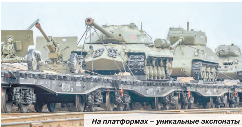
На платформах – уникальные экспонаты

Ольга ВИНУКОВА Москва