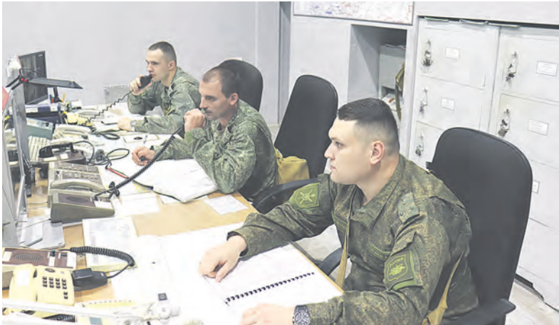
Расчёт командного пункта радиотехнического полка.

Британский самолёт-разведчик, нарушивший границу, был обнаружен подразделением архангельского радиотехнического полка СФ