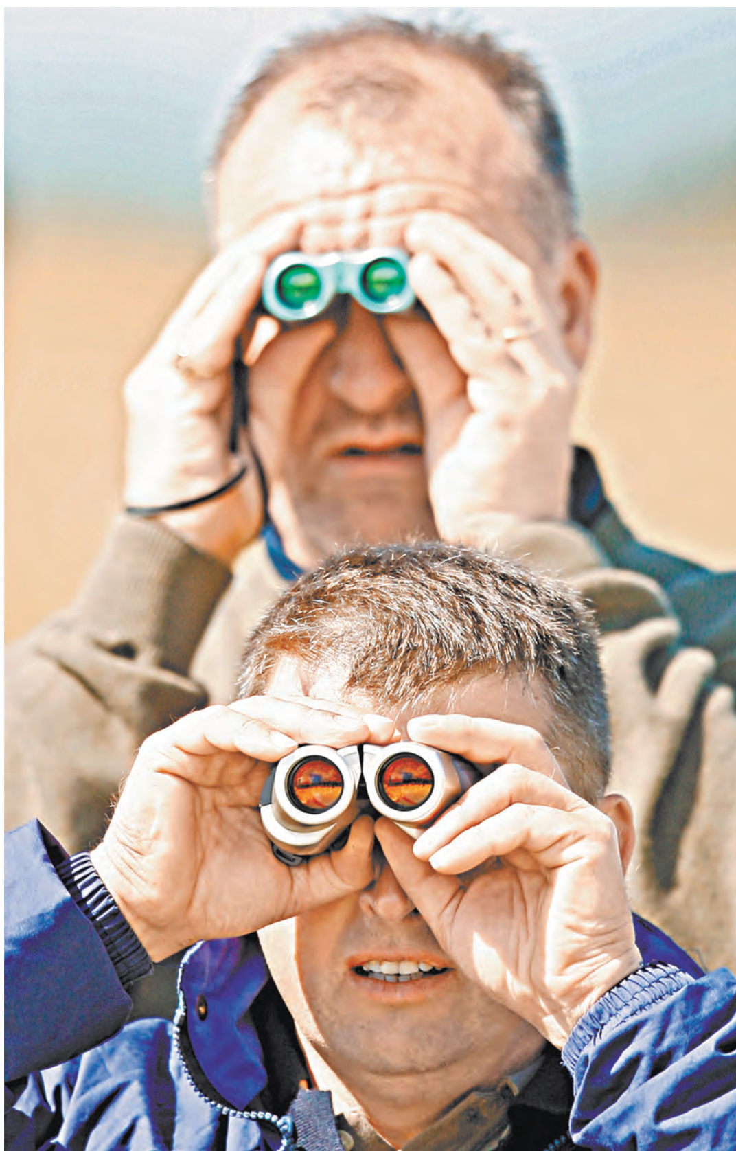
Визуальное наблюдение и даже запись вести можно, но только вне пределов жилых и служебных помещений.

Частному детективу необходимо зарегистрироваться как частному предпринимателю со всеми вытекающими обязательствами, в том числе и налоговыми. Впрочем, лицензию могут и не продлить, если в ходе проверки окажется, что деятельность детектива угрожает безопасности граждан. Например, он старался силовыми методами побудить своих собеседников к откровенности, что недопустимо. Напомним, частный детектив для обычного гражданина не является официальным представителем власти, мы не обязаны ему что-то отвечать, тем более оказывать помощь.