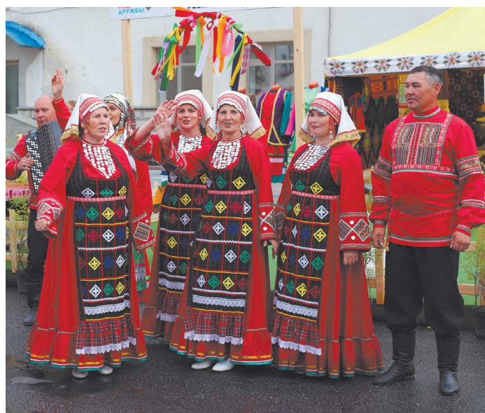
...и послушать их национальные песни.

Сегодня же уфимцы и гости форума имеют возможность посетить гала-концерт творческого фестиваля, который пройдет под знаком «Симфонической ночи». В амфитеатре конгресс-холла выступят Национальный симфонический оркестр Республики Башкортостан, солисты ведущих оперных театров России. На сцену также выйдет аккордеонист-виртуоз Петр Дранга.