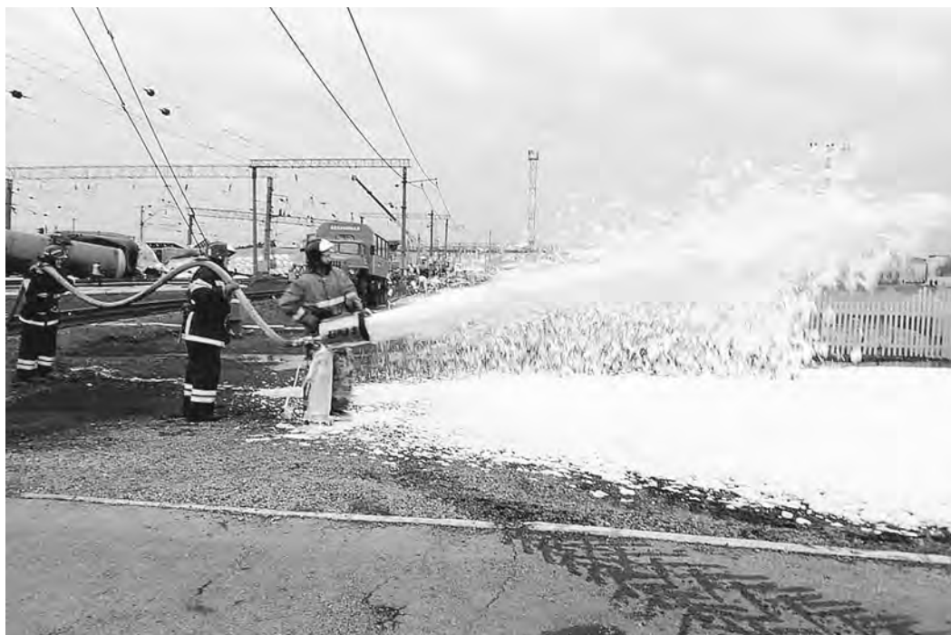
ГУ МЧС ПО НОВОСИБИРСКОЙ ОБЛАСТИ