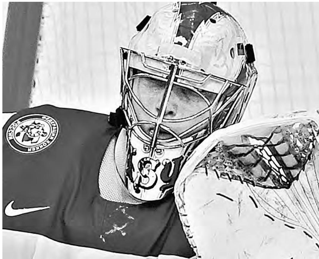
Своего Василевского у американцев в матче с нашими не оказалось.

Под впечатлением от победы остался даже президент страны Владимир Путин. Через пять ми-