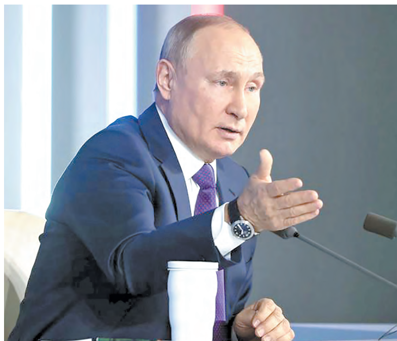
Верховный Главнокомандующий ВС РФ Президент России Владимир Путин отвечает на вопросы журналистов

— По поводу гарантий и будет ли что-то зависеть от хода переговоров [с Западом]. Наши действия будут зависеть не от хода переговоров, а от безусловного обеспечения безопасности России сегодня и на историческую перспективу. В этой связи мы ясно и чётко дали понять, что дальнейшее