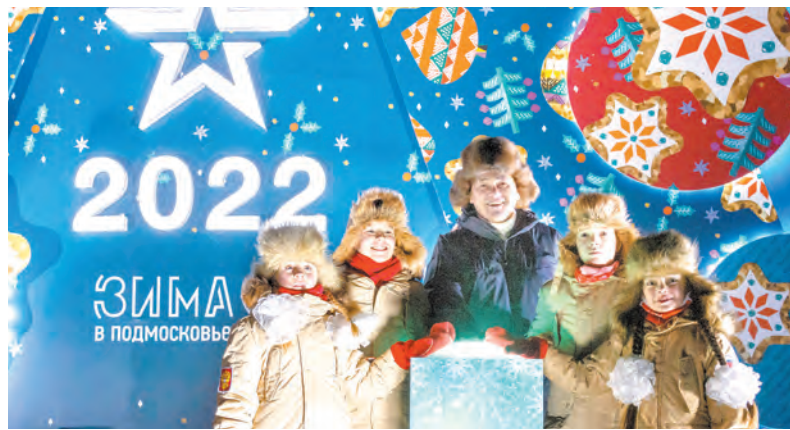
Генерал армии Сергей Шойгу и юнармейцы зажигают ёлку