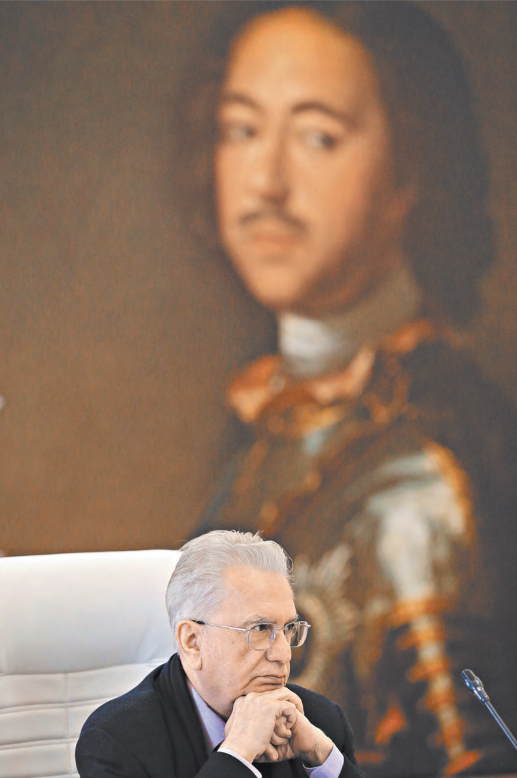
Михаил Пиотровский: Сейчас время внутренней мобилизации — каждый должен делать свое дело на своем месте.

В феврале у нас в Казани открылась выставка «Александр Македонский. Путь на Восток» с фресками Средней Азии, бактрийским серебром, Кораном, персидскими рукописями, в том числе «Хамсе» Низами. Так вот поход Александра привел к взаимодействию культур, рождению эллинизма, культурному развитию.