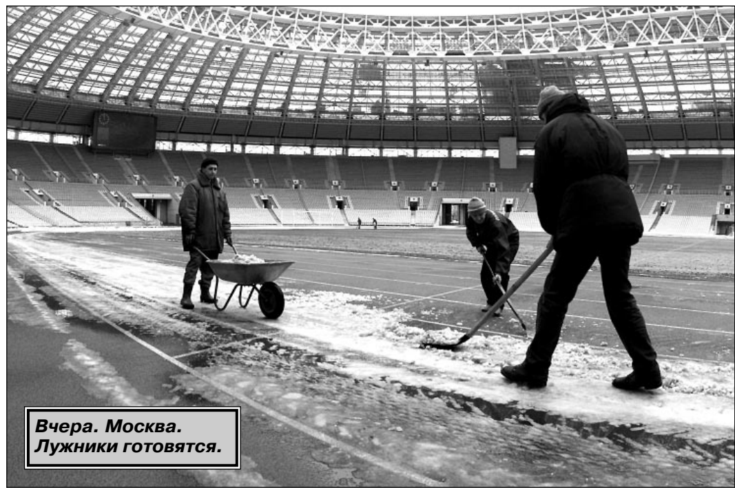
Вчера, Москва. Лужники готовятся.

Облачная погода. Кратковременный снег. Ветер северо-западный, 6 - 9 м/с. Температура воздуха минус 4 - 6 градусов.