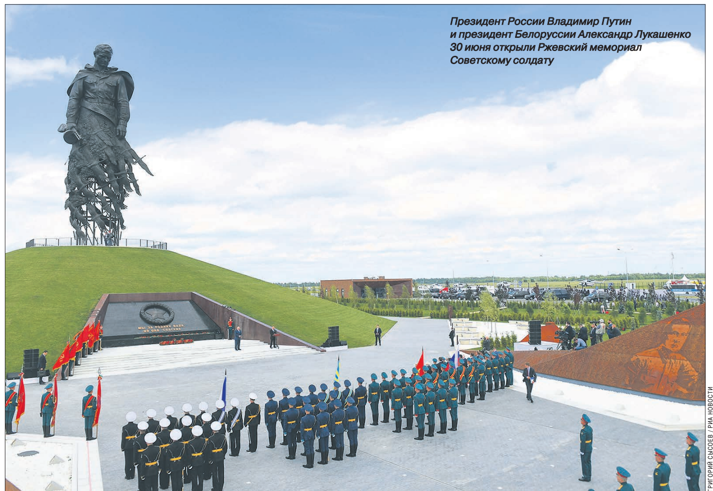
Президент России Владимир Путин и президент Белоруссии Александр Лукашенко 30 июня открыли Ржевский мемориал Советскому солдату

В Тверской области открыт уникальный памятник