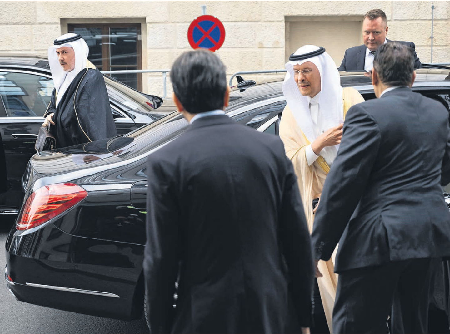
Саудовская Аравия, позиция которой во многом определяет ситуацию и в ОПЕК+, и на нефтяном рынке в целом, ведет себя все более резко и непредсказуемо

Хотя добыча РФ в 2024 году будет составлять 9,3 млн б/с, речь идет только об объемах, учитываемых в рамках сделки ОПЕК+, то есть без газового конденсата. В 2022 году в России добыт 41 млн тонн конденсата, тогда как добыча нефти составила 493 млн тонн. Таким образом, совокупная добыча жидких углеводородов в 2024 году может сократиться примерно на 5,6% относительно 2022 года, до 504 млн тонн, если добыча конденсата не вырастет. Базовый прогноз Минэкономики осенью 2022 года предполагал добычу в 2024 году в размере 495 млн тонн, а в последнем прогнозе, представлен-