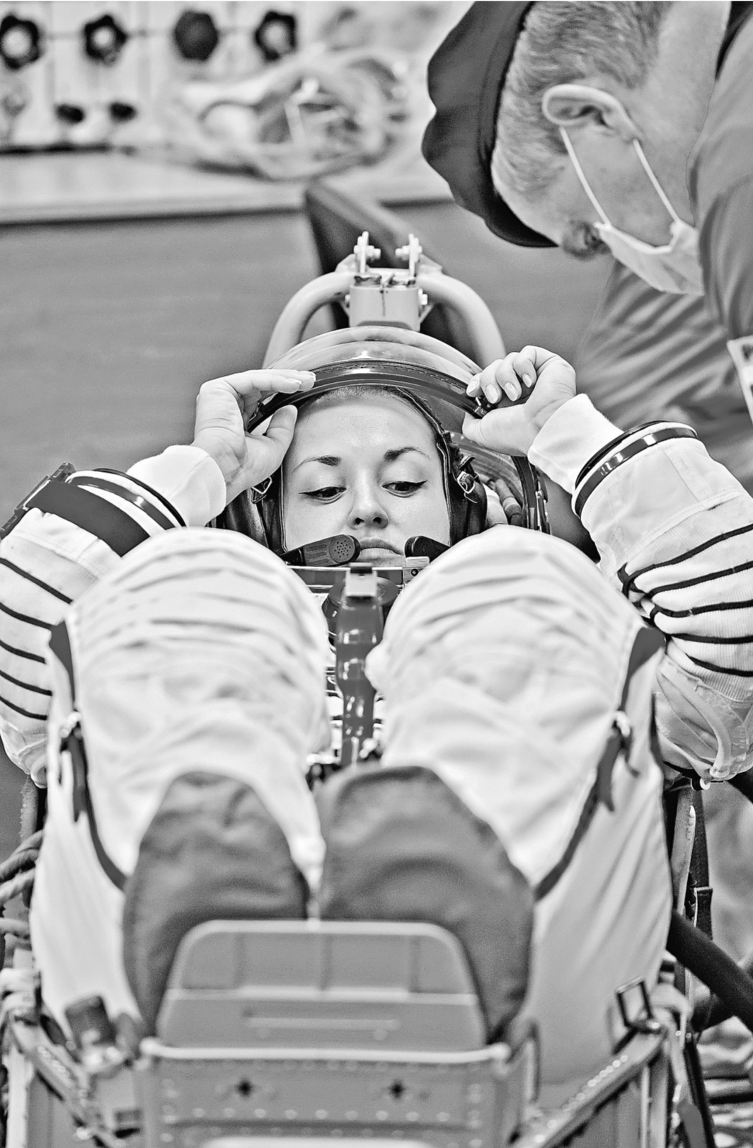
Елена Серова: На борту МКС еще не было ни одной российской женщины. И я счастлива, что буду там работать.