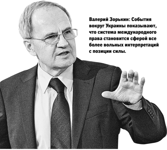
Валерий Зорькин: События вокруг Украины показывают, что система международного права становится сферой все более вольных интерпретаций с позиции силы.

Валерий Зорькин, председатель Конституционного суда России Глобальная ситуация, в которой мы сейчас находимся, становится все более опасной. События вокруг Украины показывают, что система международного права становится сферой все более вольных интерпретаций с позиции силы. И это, как мне представляется, диктует нам острую необходимость форсированной модернизации очень многих сфер нашей жизни. Не хотел бы драматизировать, но боюсь, что вскоре форсированная модернизация потребует активной — и коллективной! — мобилизации сил и