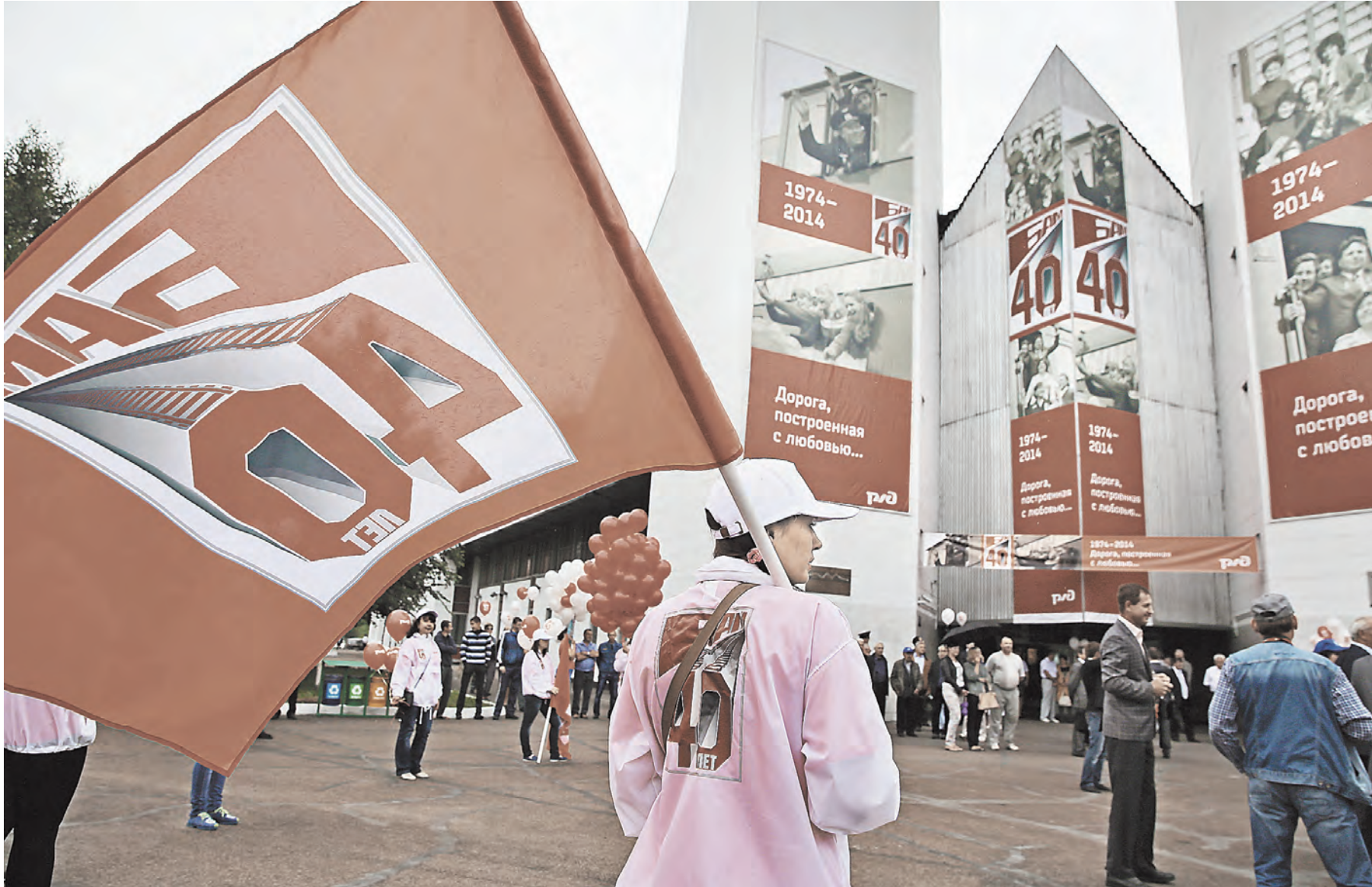
БАМ: сорок лет спустя. Эту историю несколько поколений советских людей писали крупными буквами.