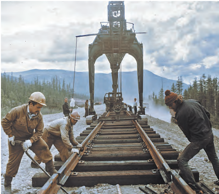
По воспоминаниям очевидцев, на БАМе неплохо зарабатывали — порядка 1 000 рублей в месяц. Для сравнения: стипендия в вузе была тогда 40 рублей, а заработная плата рядового инженера — 120 рублей в месяц.