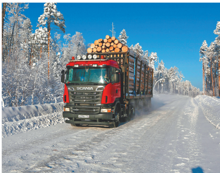
АДМИНИСТРАЦИЯ БОГУЧАНСКОГО РАЙОНА

Даже простое перечисление самых значимых богучанских новостроек займет немало места на газетной странице. Тем не менее вот некоторые из них: в 2019 году открыт мост через реку Иркиневу (приток Ангары), который обеспечил круглогодичное сообщение с поселками на правобережье, а также соединил райцентр с соседним Мотыгинским районом. Тогда же