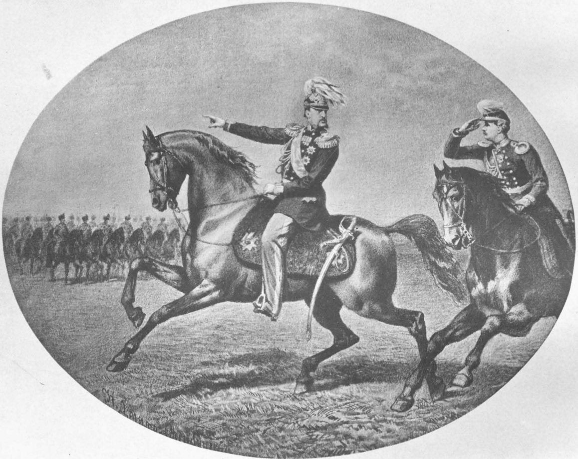
ГЕНЕРАЛЪ-ИНСПЕКТОРЪ КАВАЛЕРІИ, ЕГО ИМПЕРАТОРСКОЕ ВЫСОЧЕСТВО ВЕЛИКІЙ КНЯЗЬ НИКОЛАЙ НИКОЛАЕВИЧЪ СТАРШІЙ. А