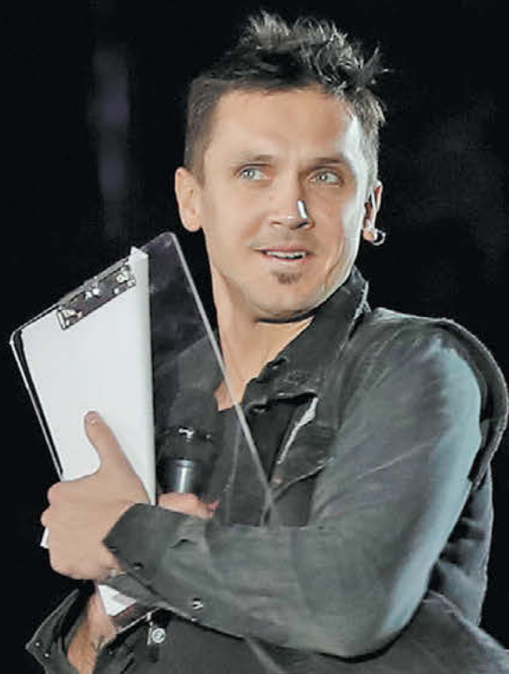
Александр Федоров «СЭ» / Canon EOS-1DX Mark II