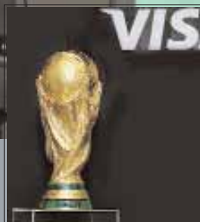
Кубок Мира FIFA 2010 в России

Подписные индексы: 47743 по каталогу «Роспечать», 40917 по каталогу «Пресса России», 99720 по каталогу «Почта России»