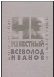
Иванов Вс. Неизвестный Всеволод Иванов.

5 Это первое научное издание произведений Всеволода Иванова. Филологи, историки литературы и поклонники творчества Иванова найдут здесь его неизвестные и малоизвестные тексты, материалы, уточняющие творческую биографию писателя и позволяющие переосмыслить некоторые спорные концепции его литературного наследия. Большая часть материалов печатается впервые.