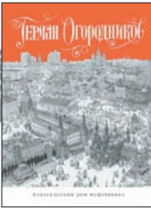
Огородников Г. Крокодил... и не только: Журнальная графика. М.: Издательский Дом Мещерякова, 2011. – 192 с.

1 Это только кажется, что рисовать карикатуры легко. Но Герману Огородникову это удается уже много лет. Вот, что говорят о нем: «Славен своей любовью к котам. Манера довольно небрежная, но это придает рисункам очарование непосредственности. Рисунки часто настолько насыщены деталями, что обычная иллюстрация превращается в панорамное полотно».