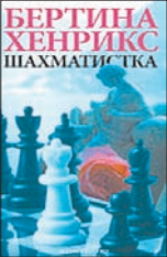
Хенрикс Б. Шахматистка / Пер. с фр. Е.Леоновой. М.: Иностранка, Азбука-Аттикус, 2011. – 176 с.