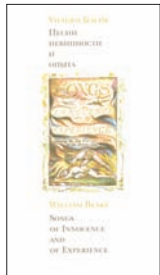
Блейк У. Песни невинности и опыта. М.: Центр книги Рудомино, 2010. — 240 с.: ил.

7 Блейк-художник, Блейк-поэт, Блейк-философ — каждая из ипостасей впервые так полно раскрывается в одном издании, напечатанном по образцу малоформатной книги, с факсимильными репродукциями, сделанными с копий, что хранятся в Кембридже, и английскими транскриптами. Все переводы в книге — новые и принадлежат разным авторам: известным и начинающим.