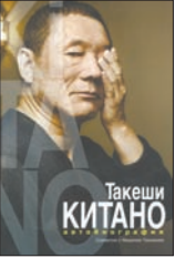
Китано Т. Такеши Китано: Автобиография / Пер. с фр. К.Поздняковой. М.: РИПОЛ классик, 2011. – 320 с. – (Биография-легенда).

2 История жизни самого влиятельного и авторитетного режиссера современной Японии рассказана им самим и записана французским журналистом Мишелем Темманом. Она удивительно похожа на сценарий к еще не снятому фильму Такеши Китано — с присущими ему драйвом и энергетикой. Но одновременно это и весьма откровенная исповедь.