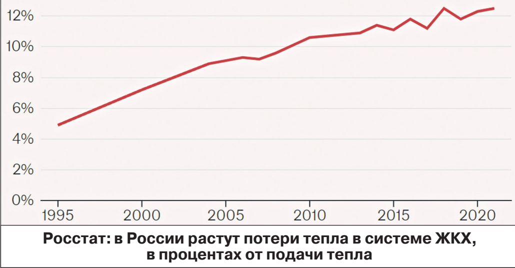
Росстат: в России растут потери тепла в системе ЖКХ, в процентах от подачи тепла

В РОССИИ есть свой газ, но для миллионов людей он недоступен, в регионах до трети населения с трудом оплачивают жилищно-коммунальные услуги, а тысячи людей ежедневно остаются без отопления из-за аварий.