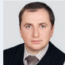
ДУБОВИК Антон Викторович , начальник Управления бюджетного учета и отчетности Казначейства России