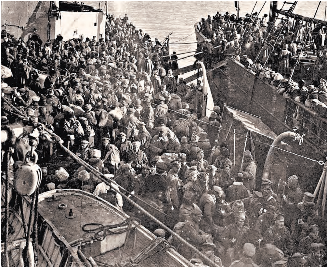
Леонид Радзиковский, политолог