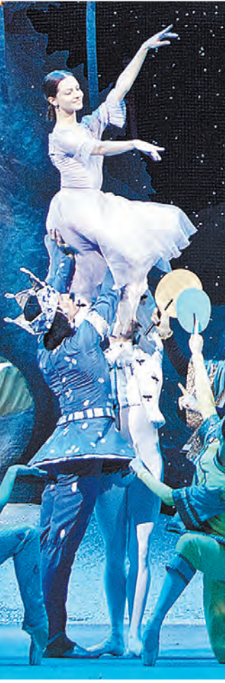
ДАМИР КИШЕВ / БОЛЬШОЙ ТЕАТР

10 Большой театр отложил продажу билетов на «Щелкунчика»