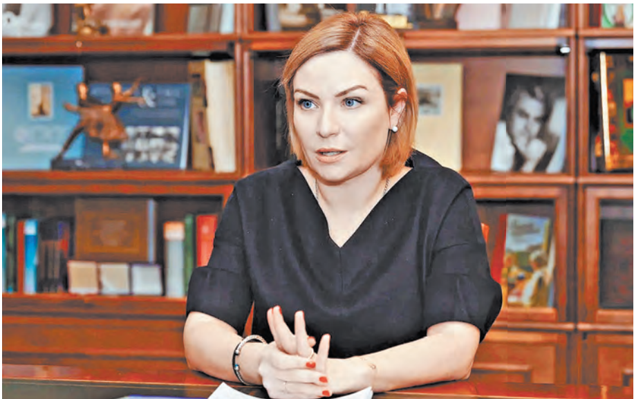
Ольга Любимова: В детских школах искусств «прорастает» будущее оперы, балета, театра, кино...

ПРОЕКТ Какие права и обязанности получат удаленные сотрудники