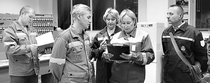
Сотрудники завода вновь продемонстрировали высокий уровень профессиональных компетенций.