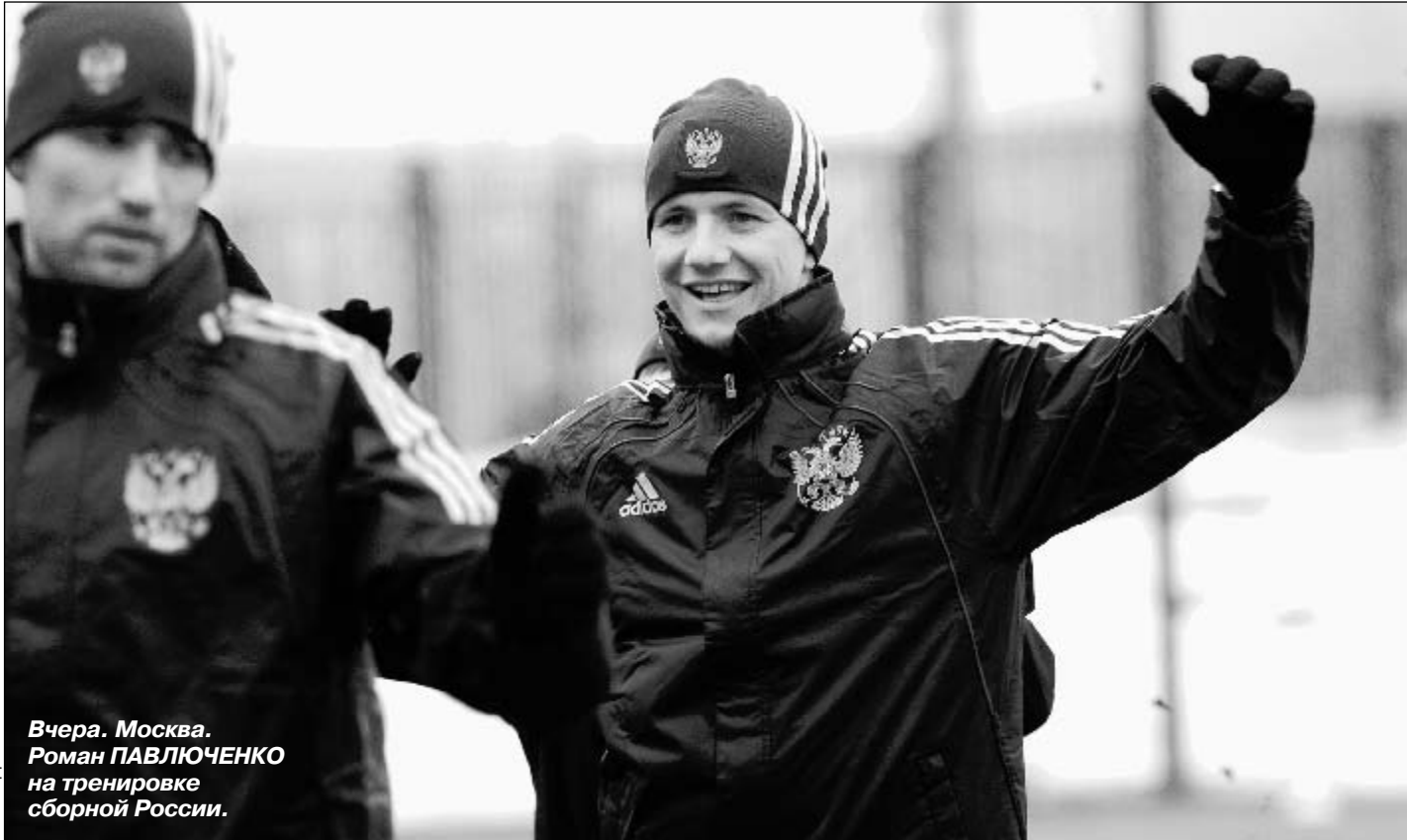
Вчера, Москва. Роман ПАВЛЮЧЕНКО на тренировке сборной России.

- Тогда закроем эту тему и перейдем к реальным проблемам. Представьте, что будет в России, если сборная неудачно сыграет в Ереване? - С хорошего вопроса начинаете - судя по всему, внимательно Daily Mail читаете (смеется). Нет, не представляю, поскольку мы сыграем удачно. Нам обязательно надо выиграть. - Между тем кредит доверия к национальной команде в стране заметно упал... - Так всегда бывает после неудач. Вот выиграем несколько матчей - и все вернется на круги своя. Играть-то мы умеем, что не раз доказывали. - Но после матча с Ираном критика стала не просто злой - уничтожающей. - Во-первых, не надо все-таки путать товарищеские матчи с официальными. Разве в игре против Ирландии наша команда