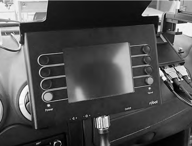
Штрафы за нарушения, выявленные новым радаром, пока выписываться не будут.

Госавтоинспекторы Татарстана приступили к испытаниям нового мультирадарного комплекса «Робот», обладающего рядом особенностей в сравнении с уже стоящими на вооружении ГИБДД комплексами фото- и видеофиксации. Главной из них является способность выявлять нарушения не только в стационарном режиме, но и в движении. Системы разместили на базе отечественных автомобилей. Они, как пояснили в Госавтоинспекции, будут патрулировать наиболее аварийные участки дорог в республике. «Робот» оснащен 11-мегапиксельной камерой, что позволяет распознавать госномер автомобиля на расстоянии до одного километра. До и после момента непосредственной фиксации нарушения комплекс осуществляет видеосъемку, что обеспечивает неоспоримую доказательную базу. Кроме того, специалисты называют новые приборы одними из самых трудноуловимых для радар-детекторов, которые устанавливают в свои автомобили многие водители. Помимо превышения скорости, комплекс может фиксировать выезд на встречную полосу. Последнее является новинкой среди подобных устройств. Совсем недавно для выявления такого серьезного нарушения в республике начали использовать аэростаты. Эксперты отмечают, что «Робот» зарекомендовал себя уже в 70 странах мира. Окажется ли он эффективным в Татарстане, сотрудники ГИБДД оценят позже, изучив динамику снижения аварийности на участках дорог, где работают новые комплексы. Тимур Алимов, Казань