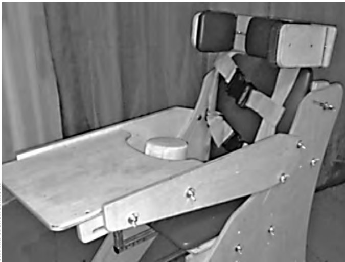
Ребенок-инвалид постоянно травмировался, задевая гайки-барашки.