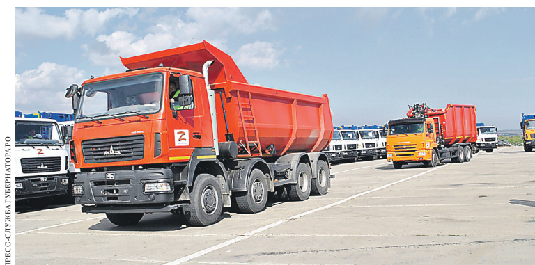
Спецтехника из России поможет навести в Мариуполе порядок.

— Только за три летних месяца Ростовская область направила жителям ЛДНР более 250 тонн гуманитарных грузов. Регион все это время активно принимал участие в помощи как людям, вынужденным покинуть республики и находящимся в пунктах временного размещения, так и самим сопредельным территориям. Весной донские аграрии помогли фермерам и личным подсобным хозяйствам ЛДНР посевным материалом. Считаю, что организации, которые нашли возможность поддержать соседей, показали достойный пример социально ответственного бизнеса.