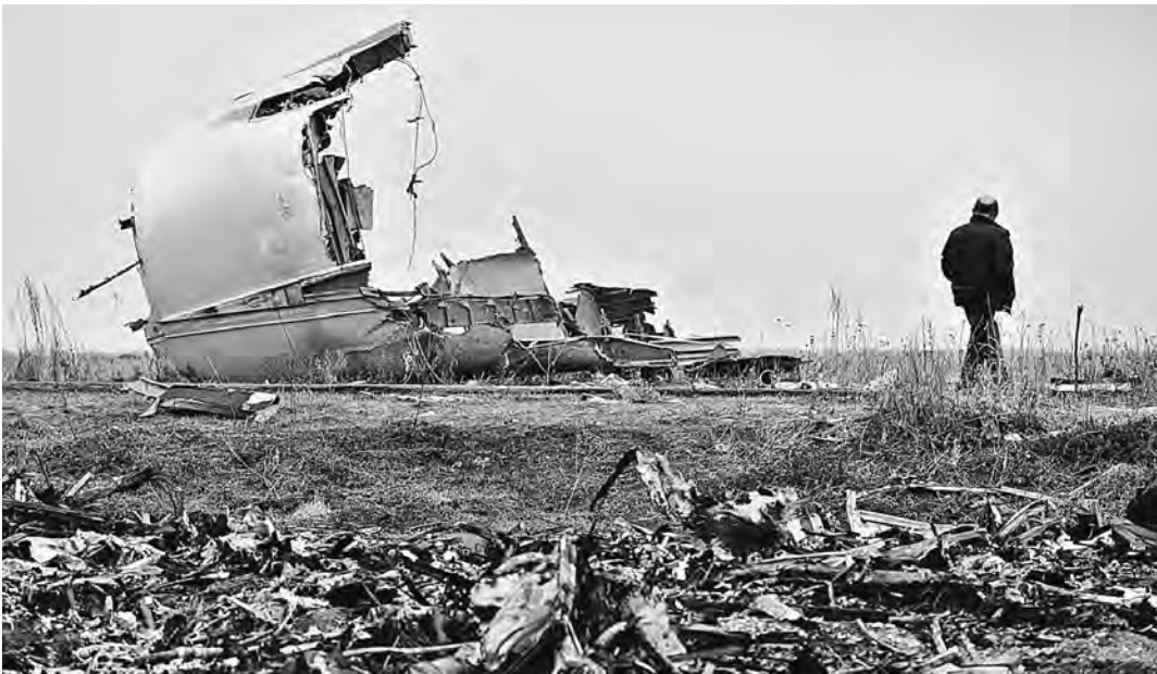
В деле о сбитом «Боинге»—новый свидетель.

В главные строчки новостей попало резонансное интервью, опубликованное накануне в «Комсомольской правде». Его дал пришедший в редакцию житель Украины. В редакции проверили его документы. Убедились—он не актер и не подставное лицо. Этого человека сегодня называют условно Александр—у него на Украине остались родственники и он боится мести и шантажа. 17 июля 2014 года Александр нес службу на украинской авиабазе неподалеку от Днепрпетровска. В тот день в небе Украины потерпел катастрофу малайзийский пассажирский «Боинг-777». А незадолго до катастрофы с авиабазы поднялись в воздух штурмовики Су-25, вооруженные, что нехарактерно для таких самолетов, ракетами «воздух-воздух». Вернулся на базу лишь один. Ракет под крыльями не было.